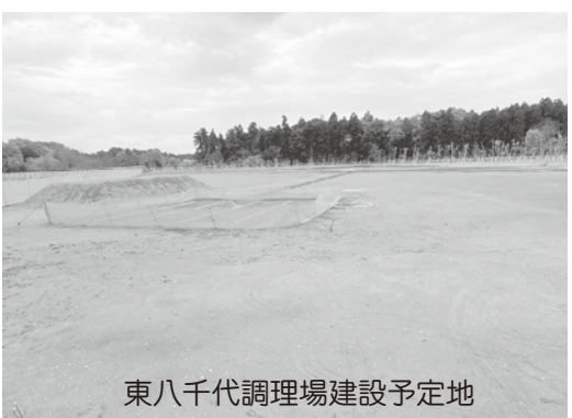
東八千代調理場建設予定地

たが、八千代市は、この提案を断りました。しかし、市は、2019年に「土地利用計画」を住宅系から商業系へ変更し、無償提供を受けた土地に東八千代調理場の建設を計画しています。